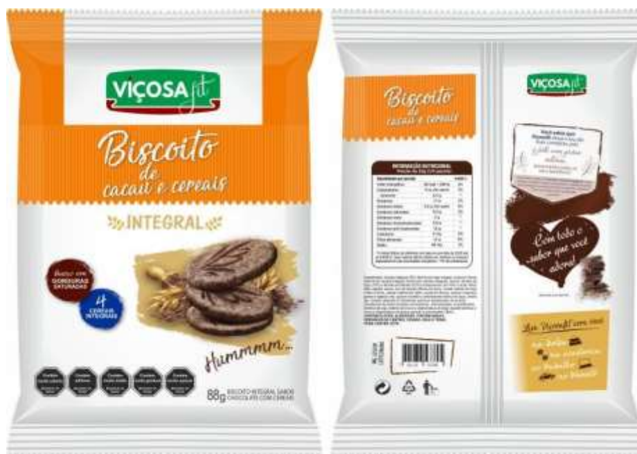
Figura 2 – Embalagem com a rotulagem de modelo FOP Câmara Interministerial de Segurança Alimentar e Nutricional - CAISAN, tabela de informação nutricional e lista de ingredientes