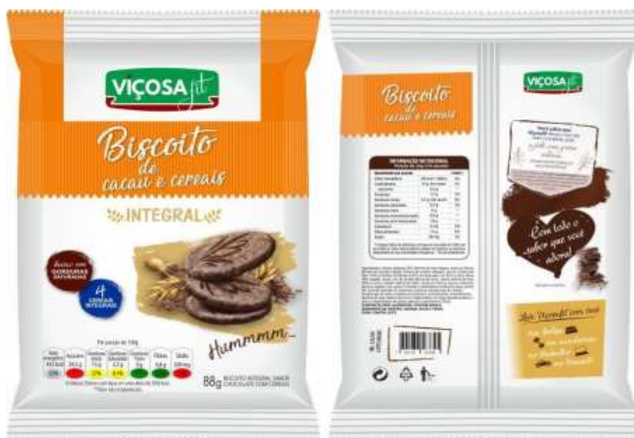
Figura1 – Embalagem com a rotulagem de modelo FOP Semáforo Nutricional, tabela de informação nutricional e lista de ingredientes

demanda tem aumentado, por incluir na variedade de produtos mais saudáveis e nutritivos. Por estes motivos, sua embalagem foi escolhida para ser avaliada por meio das técnicas ANCFEM e do rastreamento ocular. Na Figura 1 e 2 são apresentados dois modelos de embalagens estudados para as duas metodologias usadas no estudo.