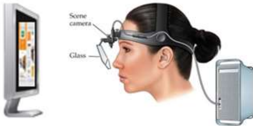
Figura 3 – Eye Tracking com participante observando a embalagem enquanto é gravado o seu trajeto ocular.