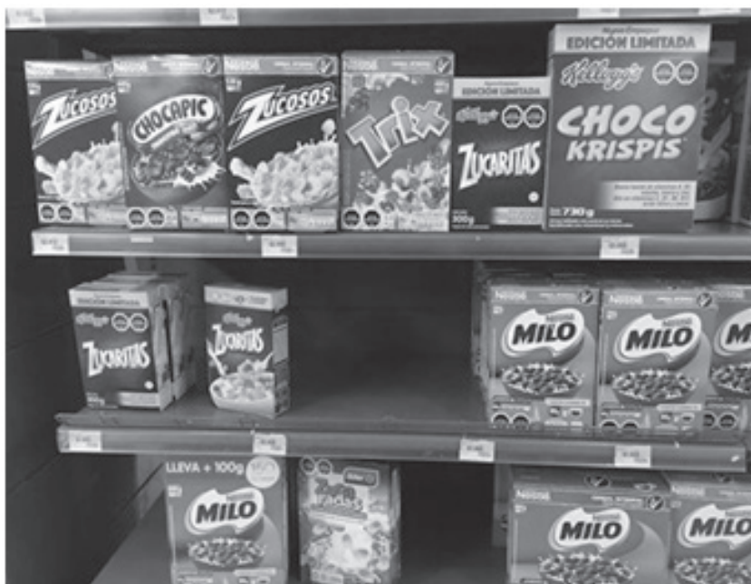
Estantería en un supermercado chileno. 25

Estos interrogantes tampoco han sido resueltos de manera pacífica internacionalmente. Distintos comités de la Asociación Interamericana de Propiedad Intelectual (ASIPI), por ejemplo, han criticado fuertemente las medidas adoptadas por el Estado mexicano, pues consideran que, al eliminarse el uso de caricaturas y dibujos de los empaques de los productos alimenticios para consumo humano, se están imponiendo limitaciones excesivas sobre el uso de la marca, cuando aún no se han comprobado beneficios directos para los consumidores (Asociación Interamericana de Propiedad Intelectual, 2019).